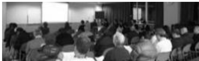
▲第3回富久公園部会の様子