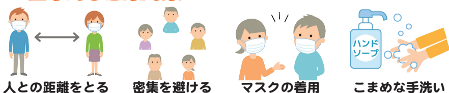
人との距離をとる