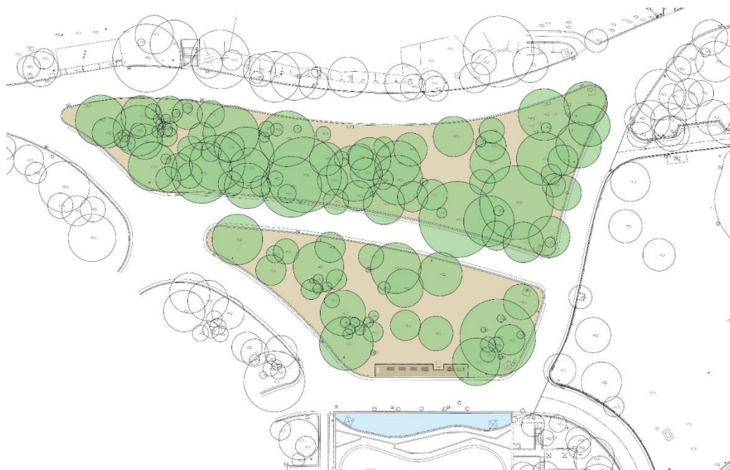
現在の状況（平面図）