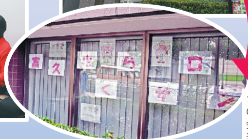
タワーマンションの一階にサロンの会場である町会事務所があります。