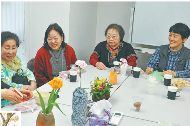
◀サロン主催のまちあるき

▶サロンの参加者の方からも、「顔見知りが増えたことであいさつをする相手が増えて嬉しい」などの声をいただいています。