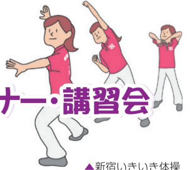
▲新宿いきいき体操

新宿いきいき体操は、介護予防のためのストレッチや筋力アップ、バランス能力アップの動作が盛り込まれた体操です。