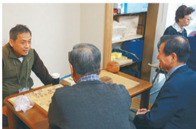
▲囲碁や将棋などの趣味の活動

月に一度町会事務所に集まってお互いの近況報告をするほか、趣味の活動や健康・福祉に関する勉強会なども行っています。現在は新型コロナの影響でサロンはお休みしていますが、コロナ禍においてもお互いに連絡を取り合うなど、交流を続けています。