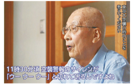
11時30分頃 空襲警報のサイレンが「ウーウーウー」と切れて鳴るんですね