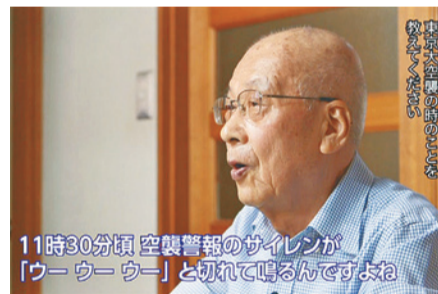
11時30分頃 空襲警報のサイレンが「ウーウーウー」と切れて鳴るんですね