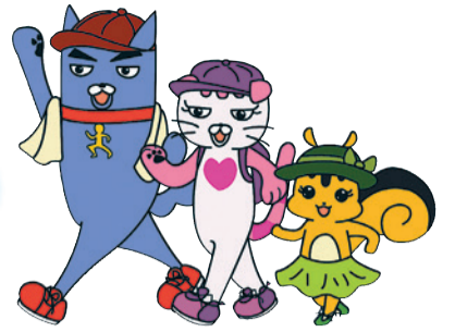
▲しんじゅく健康フレンズ