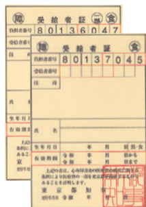
▲お送りする新しい受給者証は黄色です

【対象】原則として、区内在住で健康保険に加入し、2019年(平成31年1月～令和元年12月)中の所得が基準額以下で、次のいずれかに該当する方 ▶身体障害者手帳1級・2級(内部障害者は1～3級) ▶愛の手帳1度・2度 ▶精神障害者保健福祉手帳1級 ※所得基準額は扶養親族等がない方は360万4,000円。以降、扶養親族等が1人増えるごとに38万円を加算。詳しくは、お問い合わせください。以前に資格