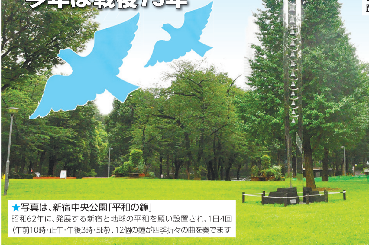
★写真は、新宿中央公園「平和の鐘」 昭和62年に、発展する新宿と地球の平和を願い設置され、1日4回(午前10時・正午・午後3時・5時)、12個の鐘が四季折々の曲を奏でます

今日8月15日、終戦から75年が経過しました。空襲により、新宿区も約8割の地域が焼き尽くされ、がれきのまちと化しました。 これらの悲惨な出来事を風化させず、平和な世界を築き上げるためにも、私たち一人一人が常に平和の尊さを認識し、その大切さをともに考えなければなりません。次の世代に二度と引き起こしてはならない戦争の悲惨さと平和の大切さを語り継いでいきましょう。 【問合せ】総務課総務係(本庁舎3階) ☎(5273)3505・☎(3209)9947へ。