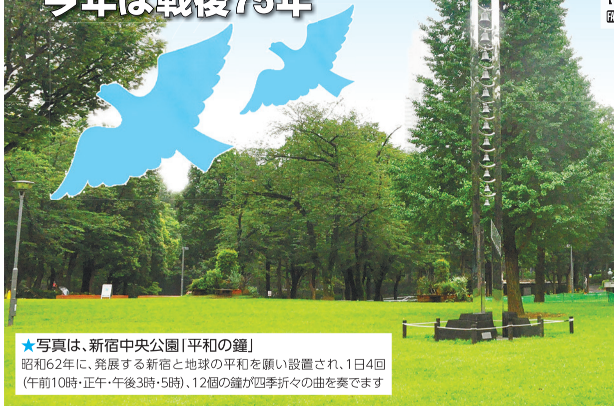
★写真は、新宿中央公園「平和の鐘」

昭和62年に、発展する新宿と地球の平和を願い設置され、1日4回 (午前10時・正午・午後3時・5時)、12個の鐘が四季折々の曲を奏でます