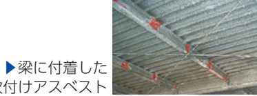
▶梁に付着した吹付けアスベスト

区では、区内に建物を所有している個人・中小企業の事業者・分譲マンションの管理組合向けに吹付けアスベストの含有調査費・除去等工事費を助成しています。 ※8月上旬以降、一部の建物所有者の方に、吹付けアスベストに関するアンケートをお送りします。ご協力をお願いします。 【問合せ】建築調整課(本庁舎8階) ☎(5273)3544へ。