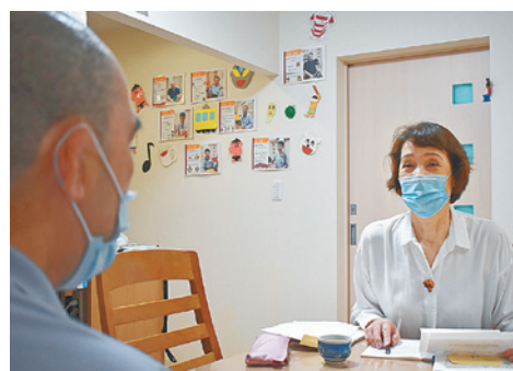
▲施設を訪問して本人の話を聞く市民後見人

区の養成講習を修了した方が市民後見人として活動できます。あなたの力を地域の成年後見人として生かしてみませんか。