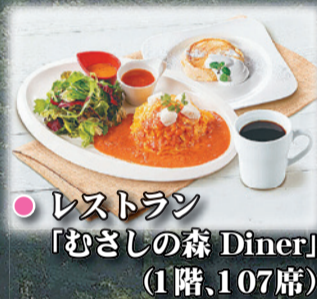
● レストラン「むさしの森 Diner」(1階、107席)

開放的な空間で休憩や食事を楽しめます。店舗のオープンに当たっては、適切な感染予防対策を行っています。