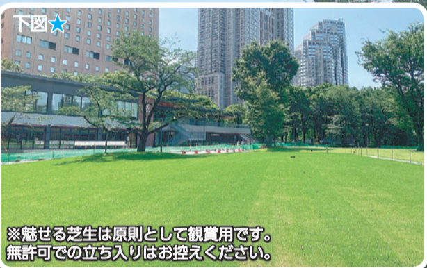
※魅せる芝生は原則として観賞用です。無許可での立ち入りはお控えください。

芝生広場エリア内に、「魅せる芝生」を新たに設けました。年間を通して緑の美しさを楽しめます。