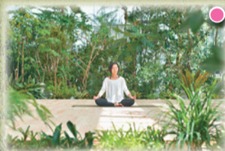
● アウトドアフィットネスクラブ「PARKERS TOKYO」(1・2階、ヨガスタジオ・ボルダリングジム・ランナースロッカー&シャワー)