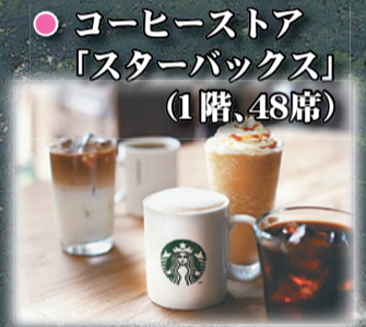
● コーヒーストア「スターバックス」(1階、48席)