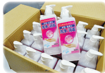
▲寄付いただいた消毒液

個人・企業・団体から新宿区に、マスク・防護服・アルコール消毒液などの寄付のご協力をいただいています。ありがとうございます。中には、「起業時に日本人に大変お世話になった」とおっしゃる中国・無錫市の方からの60,150枚のマスクの寄付もありました(下写真)。寄付されたマスクには、「同じ空のもと、ともに頑張ろう」というメッセージが込められた漢詩が添えてありました。