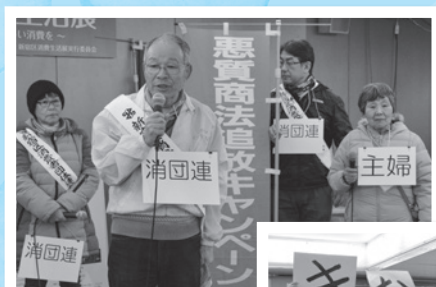
新宿区消費者団体連絡会の皆さんが、悪質商法被害防止のミニコントを行いました