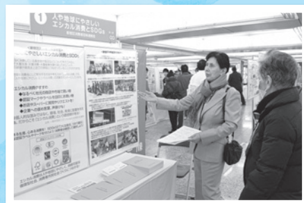
各ブースとも素晴らしい発表でした

1月17日（金）、18日（土）に新宿駅西口広場イベントコーナーにおいて、「第39回新宿区暮らしを守る消費生活展」を開催しました。みぞれ交じりの寒い日でしたが、2日間で約8,000人の方が来場されました。