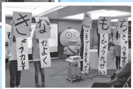
四谷小学校5年生の皆さんの発表