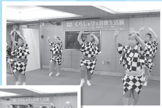
江戸芸かっぽれを踊る皆さん