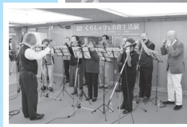
ハーモニカの素敵な音色が響きました