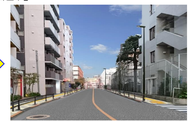
整備後のイメージ