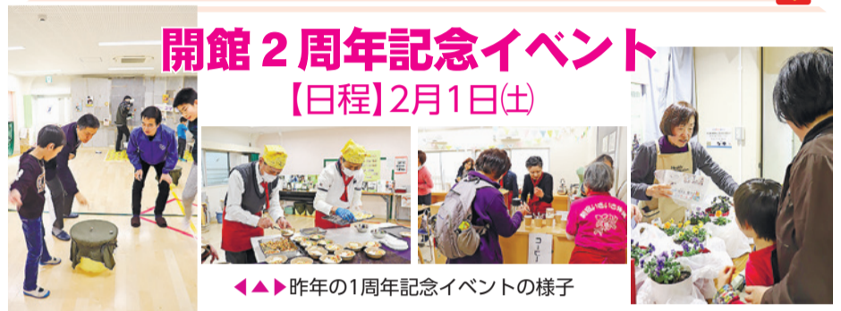
◀▶ 昨年の1周年記念イベントの様子

【時間・内容】▶①午前10時30分～12時…記念講演「縁じょい 出会い・つながり・ささえあい」(講師はダニエル・カール(写真)/タレント)、▶②午後1時30分～3時30分…バルーンアート、ゲームコーナー、ベーゴマ大会、鉢植えをプレゼントする館内スタンプラリーのほか、軽食の提供もあります。