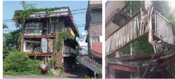
適正な維持管理が行われなくなったマンションの例