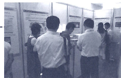
※これまでの説明会の様子