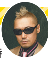
MC ギュウゾウ (電撃ネットワーク)