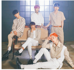
▲LIKE A MOVIE