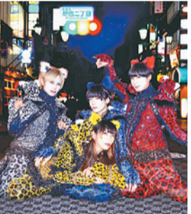
▲二丁目の魅カミングアウト