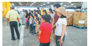
▲淀橋市場(青果)見学の様子

9月の「野菜大好き月間」では、野菜に関する多数の講座や、飲食店等の協力で実施したお得なサービスに多くの方にご参加いただきました。今後も皆さんが野菜をとるきっかけになるような取り組みを実施していきます。