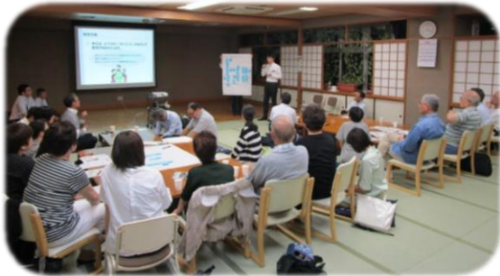
↑前回まちづくりの会の様子

前回のまちづくりの会には、計26名の方にご参加いただきました。当日は、まちづくりガイドライン改定の方針や、新たに追加するべきルール、運用方法等について、意見交換を行いました。当日挙がった意見の一部をご紹介します。