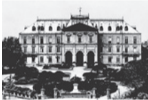
参謀本部陸地測量部