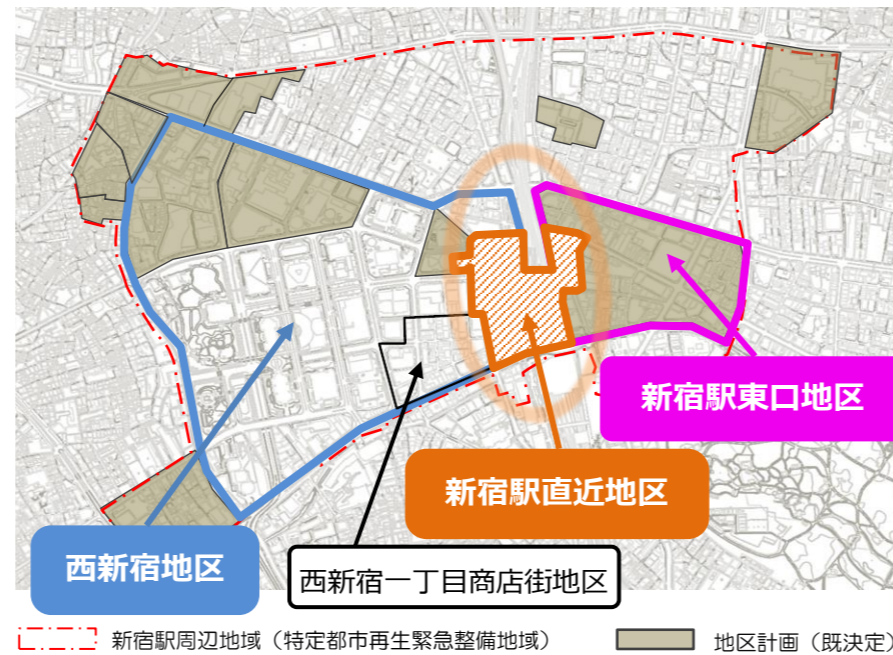
新宿駅周辺地域（特定都市再生緊急整備地域） 地区計画（既決定）