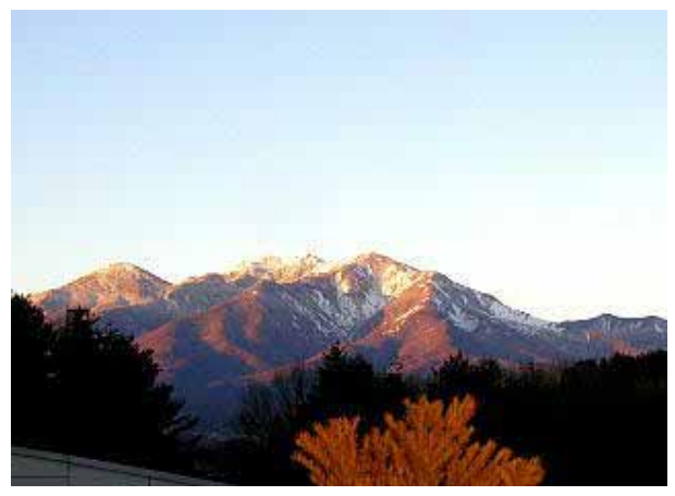
屋上よりハヶ岳を臨む