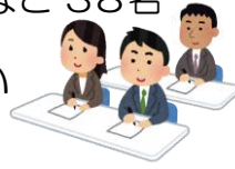
<第10回まちづくり協議会の様子>

ご希望があれば、当日配布した資料をお送りいたしますので、事務局までお問い合わせください。