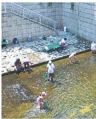
▲神田川親水テラス

【持ち物】長靴、マリンシューズまたは汚れてもいい靴(はだしやビーチサンダルは不可。川の深さは約20cm)