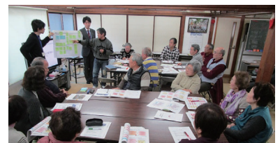
▲グループ発表の様子

また、後半では新たな防火規制区域指定案の説明会が行われ、導入する目的や指定される範囲等について、新宿区から説明がありました。