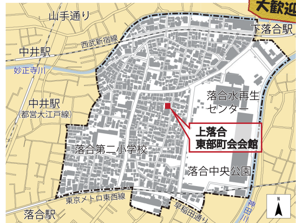
上落合東部まちづくりの会の範囲