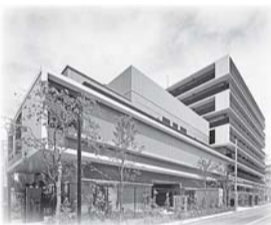
▲2019年4月に開設する小学館アカデミー飯田橋ガーデン保育園