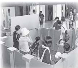
▲避難所の体制づくり(イメージ)