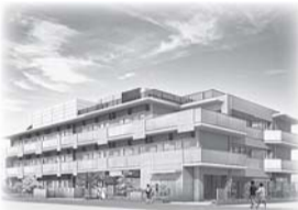
▲2019年7月に開設する特別養護老人ホーム「(仮称)とみひさ」