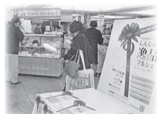
▲しんじゅく逸品マルシェ