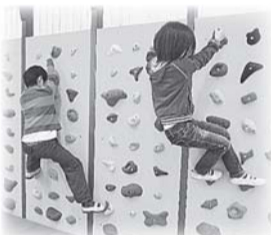
▲スポーツクライミング体験