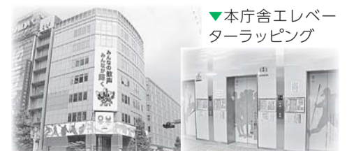
▲庁舎ラッピング(イメージ)