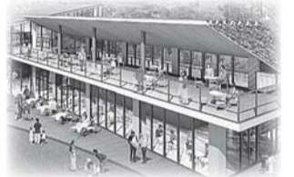
▲新宿中央公園の交流拠点施設(イメージ)