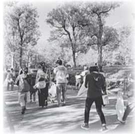
▲しんじゅくシティウォーク