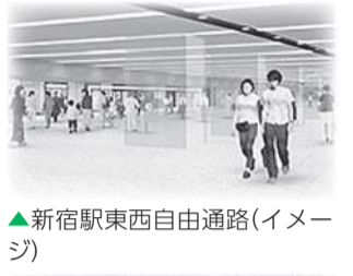
▲新宿駅東西自由通路(イメージ)