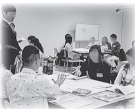
▲しんじゅく若者会議