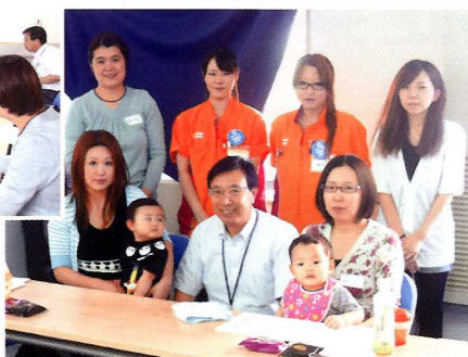
参加者とスタッフの皆さん