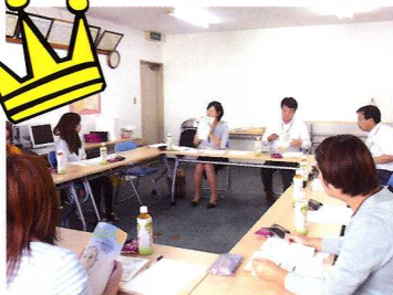
育児休業取得者 情報交換会の様子