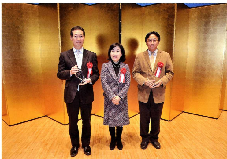
平成22年度受賞2社代表者と中山区長