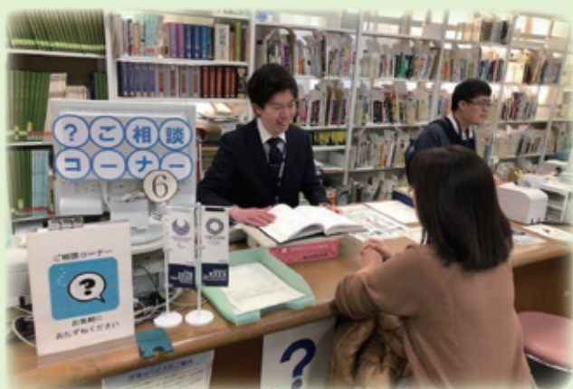
▲図書館利用機会の拡充を図ります

教育委員会では、生涯にわたって豊かに学ぶことができるよう、区民にやさしい知の拠点として、新宿区立図書館の充実に向けた取組を進めています。