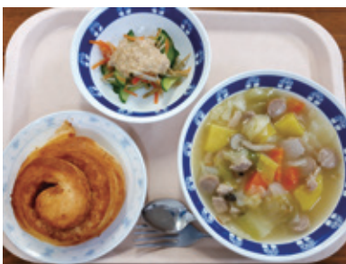
▲西新宿中学校の給食

学校の給食メニューをご紹介します。今回は、「ポトフ」と「ごほうサラダ」を紹介します。彩りがよく、野菜もたくさんとれる子どもたちに人気のメニューです。主食にパンを添えて、ご家庭でもぜひ召し上がってみてはいかがでしょうか。