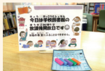
▲東戸山小学校の学校図書館放課後等開放では1回来るごとにスタンプがもらえます