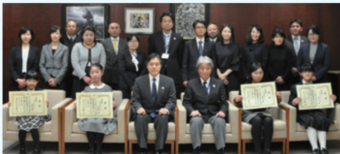
▲区長賞表彰式を開催