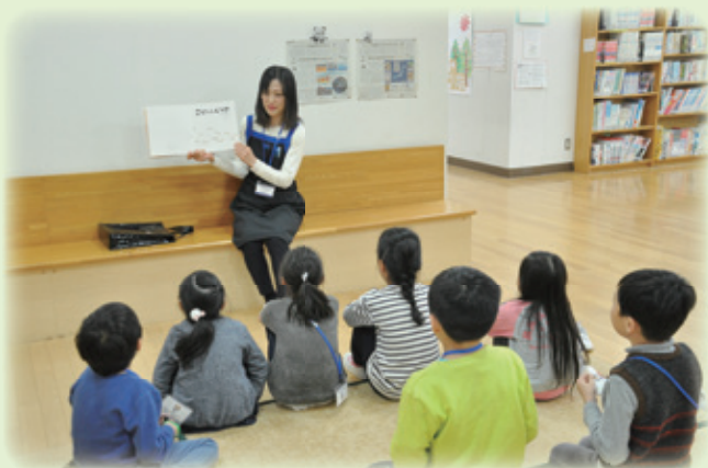
▲学校図書館放課後等開放でのおはなし会のようす(東戸山小学校)