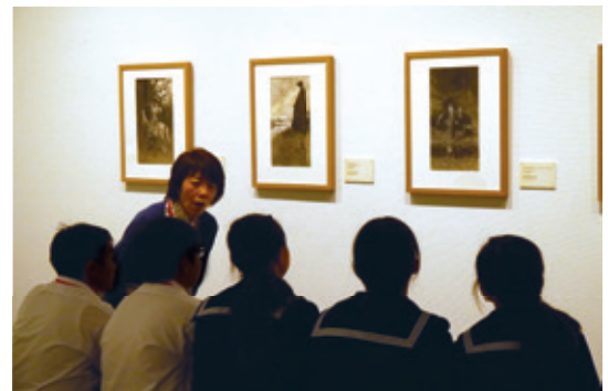
▲ボランティアのガイドスタッフが美術鑑賞教室をサポート

その後、個人鑑賞の時間では、一つ選んだ作品と、じっくり向き合い、感じたことなどをワークシートに記入し、考えを深めました。