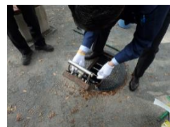
持ち手を広げて固定する