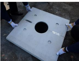
床板を敷き、仮設トイレを組み立てる