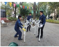
フレームを広げる