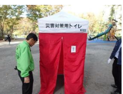
テントを便器にかぶせて完成