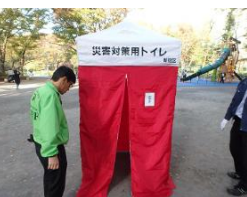
テントを便器にかぶせて完成