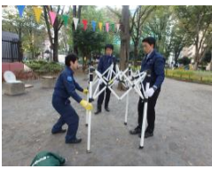
フレームを広げる