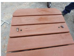
スパナでねじ（2個）を取り蓋を開ける