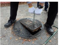
T字フックで蓋を開ける