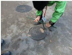
十字鍵でマンホールを取り外す