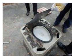
鉄板を外しねじを取る（4個）