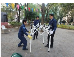
フレームを広げる