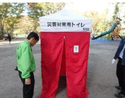
テントを便器にかぶせて完成