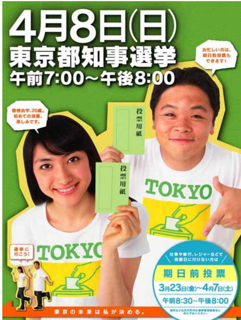
東京都知事選挙啓発ポスター(東京都選挙管理委員会作成)