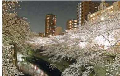
神田川の桜のライトアップ

3月 9日 落合第一地域センターまつり(同センター)。 10日 箱根山駅伝=都立戸山公園・東戸山小学校(箱根山駅伝大会実行委員会)。地域防災講演会=四谷区民ホール(危機管理課地域防災係)。 17日 平和講演会・映画会=新宿歴史博物館(総務課総務係)