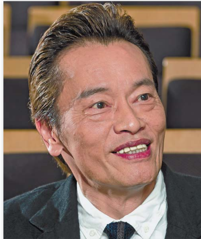
俳優 遠藤 憲一さん

区長 何事も体験してみ、初めて気が付くこともありますね。区の文化・芸術活動も同じで、まずは触れていただくことが大切だと考えています。そこで、多様な文化・芸術を育みつつ、新宿ゆかりの文化・芸術を再発見し、気軽に触れていただくための「新