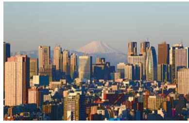
朝日の富士山と西新宿

1月 1日 歳旦祭=葛谷御霊神社。 1日から 新宿山の手七福神詣で○毘沙門天=善國寺○大黒天=経王寺○福祿寿=永福寺○弁財天=巖嶋神社○寿老人=法善寺○恵比寿=稲荷鬼王神社○布袋尊=太宗寺。干支祈願=稲荷鬼王神社。七福神まつり=成子天神社。 5日 初弁天祭=巖嶋神社。 8日 湯花神事=花園神社。 13日 おびしゃ祭=葛谷御霊神社、中井御霊神社。 14日 成人の日「はたちのつどい」=京王プラザホテル(総務課総務係)。 15日・16日 エンマ大王開帳=太宗寺。 19日 マーラー交響曲第8番「千人の交響曲」演奏会(新宿文化センター)。 20日 牛込笹笥地域まつり(牛込笹笥地域センター)。 27日 新宿シティハーフマラソン・区民健康マラソン(新宿未来創造財団)。 28日 円空仏公開(毎月28日午後)=中井出世不動堂(文化観光課文化資源係)