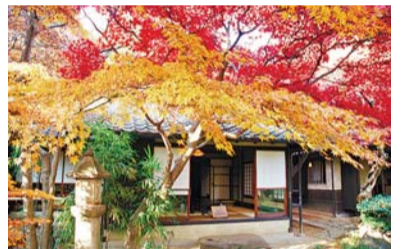
林芙美子記念館の紅葉

10月 10月~11月 新宿区生涯学習フェスティバル(新宿文化センター)。 1日~31日 大新宿区まつり(文化観光課文化観光係)。 上旬 お餅つき=出世稲荷神社。放生会=市谷亀岡八幡宮。 14日 神事高田馬場流鏑馬=穴八幡宮。放生会=放生寺。お会式=善國寺。新宿スポレク=新宿コスミックセンターほか(新宿未来創造財団)。 15日 お会式=宗柏寺。 17日 例大祭=出世稲荷神社。 19日・20日 恵比寿祭=稲荷鬼王神社。 20日 ふれあいフェスタ=都立戸山公園(文化観光課文化観光係)。 下旬 四谷文化祭・リサイクルフェア(同センター)。