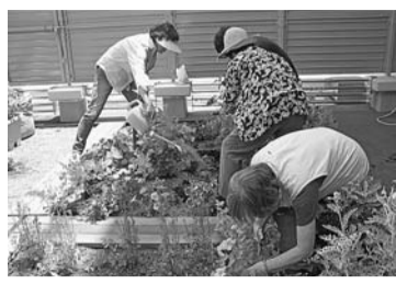
ささえーる 薬王寺の屋上庭園サポーター養成講座の様子

初めて利用する方は、住所・氏名・年齢が確認できるもの(健康保険証など)をお持ちになり、利用証の交付を受けてください。各施設では、各種教室や講座、催しなどを開催しています(内容は館により異なります)。詳しい内容や利用方法については、各館にお問い合わせください。