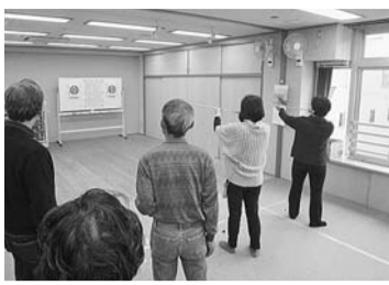
信濃町シニア活動館での団体活動(吹き矢の様子)