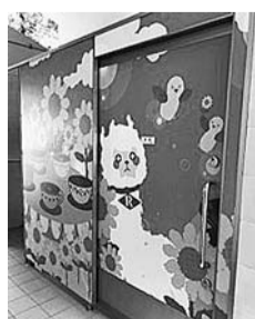
▲ちびっこ広場女子トイレ内装