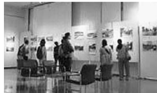
▲50年を振り返る写真展の様子

同公園が4月1日に開園50周年を迎えました。50周年を記念して、50年を振り返る写真展等のイベントを開催しました。