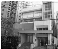
▲ささえーる 薬王寺 (市谷薬王寺町51)

世代に関わらずお互いに助け合い、支え合う「地域支え合い活動」の拠点として、オープンしました。館の愛称は、区民の皆さんからの公募で決まりました。