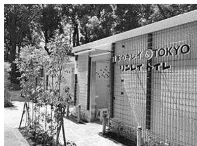
▲水の広場トイレ外観

ネーミングライツ(命名権)を導入し「日本のキレイ&TOKYOリンレイトイレ」と命名。「また訪れたくなるような、ワクワクするトイレ」をコンセプトに内外装のデザインを施したトイレをオープンしました。季節ごとにトイレのデザインを変更する予定です。