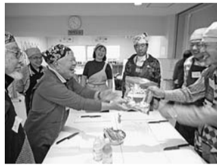
▲同館の料理講座の様子