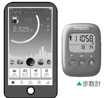
▲スマホアプリの画面