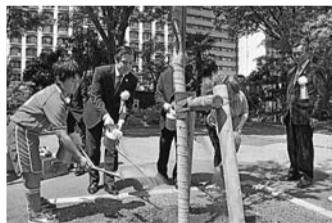
▲開園50周年を記念したケヤキの植樹

ネーミングライツ(命名権)を導入し「日本のキレイ&TOKYOリンレイトイレ」と命名。「また訪れたくなるような、ワクワクするトイレ」をコンセプトに内外装のデザインを施したトイレをオープンしました。季節ごとにトイレのデザインを変更する予定です。