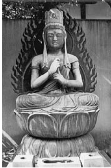
▲銅造大日如来坐像

宝永6年(1709年)に制作され、近くの二尊院に安置されていましたが、廃寺となったため永福寺に移されたといわれています。