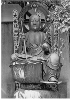
▲銅造地藏菩薩半跏像