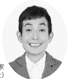
▲矢部太郎「大家さんと僕」(新潮社)