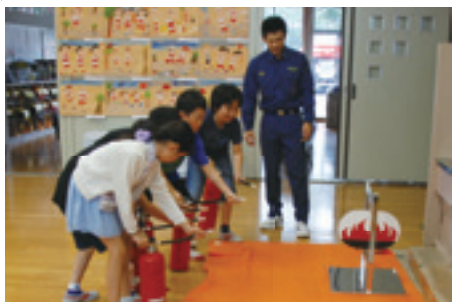
▲疑似消火器で消火器の使い方を学びました

6月21日(木)、花園小学校では全児童の参加による「防災教育と音楽のつどい」が開催されました。