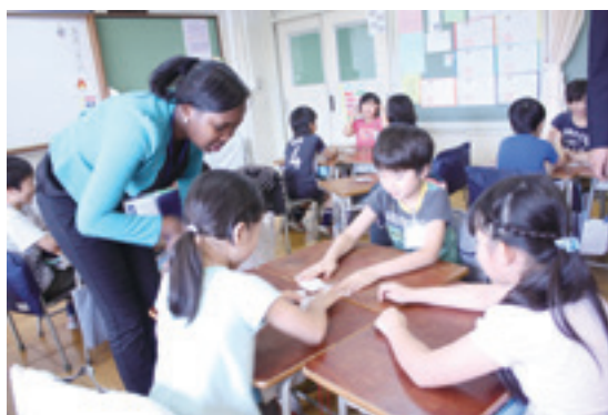
ALT配置時間数(平成30年度)

また、中学校においても、引き続き英語の授業や英語の部活動等にALTを配置して、生徒が英語に触れる機会の充実を図っていきます。