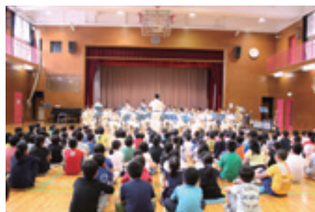
▲東京消防庁音楽隊による迫力ある演奏

自然災害や火災の発生、目の前の人急に倒れるなど、思わぬ緊急事態に遭遇した際は、落ち着いて行動することが大事です。今回の防災教育の授業で学んだ、子どもが自らの生命を守るために必要な知識や技能が、いざという時に役立つことでしょう。