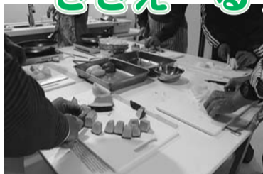
▶おひとり様のお手軽クッキングの様子