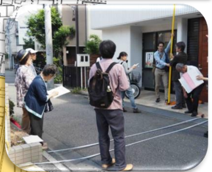
現状の道路の幅を確認しました