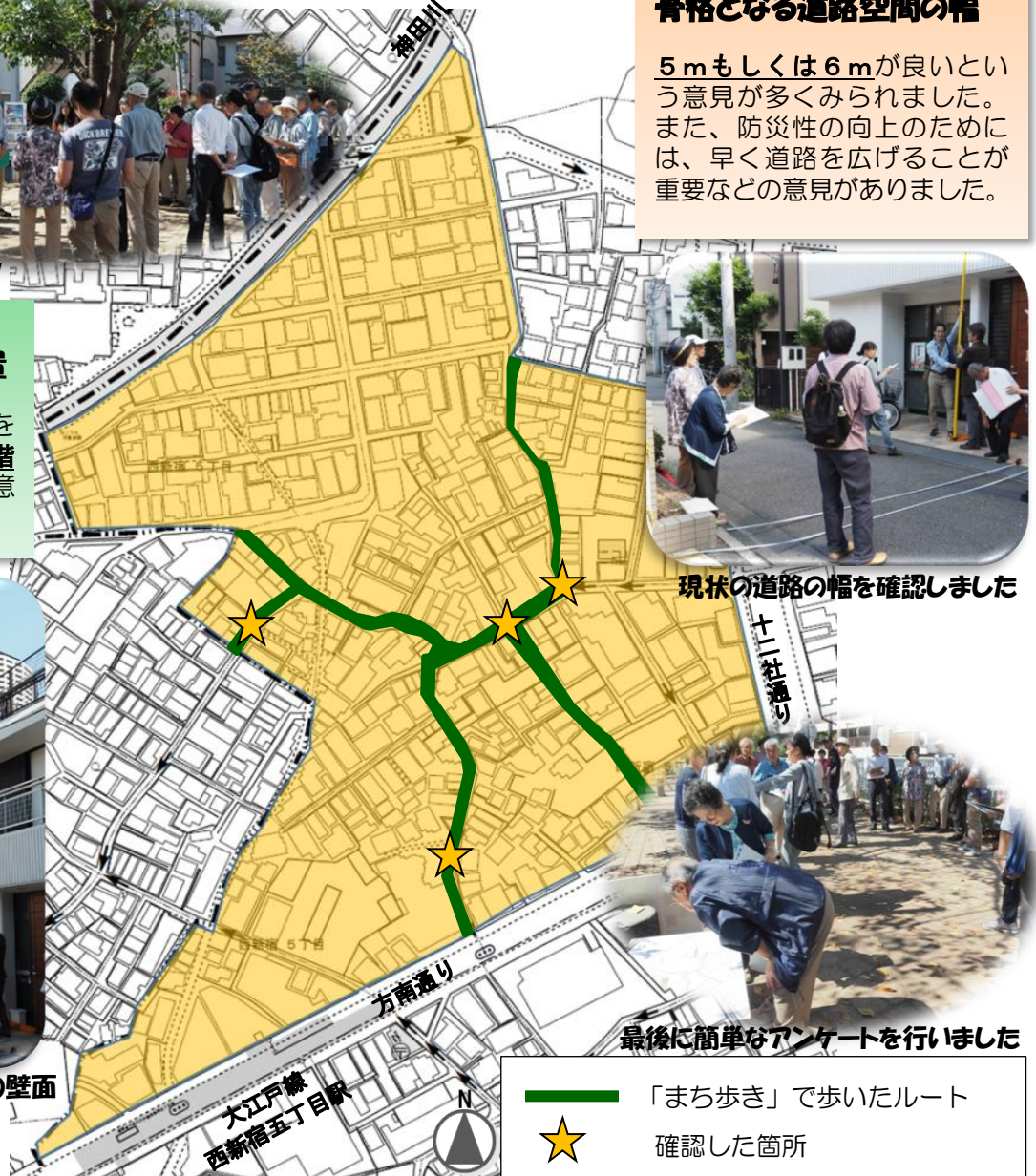
最後に簡単なアンケートを行いました