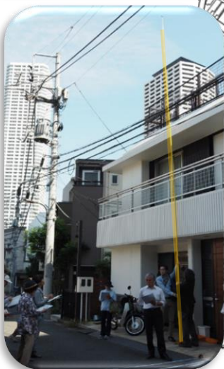
長い棒を使って、沿道の壁面の高さを確認しました