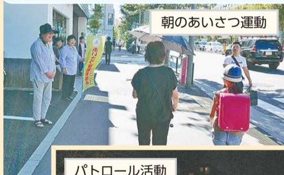
朝のあいさつ運動

春・秋の交通安全運動、子どもの登下校時の見守り、防犯パトロールや防犯カメラの設置など、地域の皆さんが安全・安心に暮らしているための活動に力を入れています。