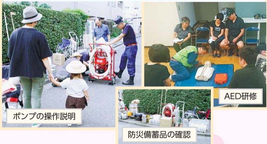
ポンプの操作説明

いざというとき、助け合える人はいますか？ 町会・自治会は自助・共助・公助が一体となって、災害に強いまちづくりに取り組んでいます。防災組織・訓練体制の強化を地域で行っています。