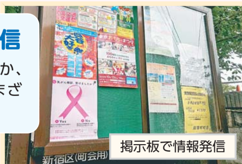
掲示板で情報発信

区のお知らせを配布するほか、掲示板などで生活に役立つさまざまな情報を提供しています。