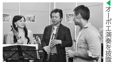
オーボエ演奏を披露

※ケーブルテレビの受信については、ジェイコム港・新宿☎0120(914)000へ。