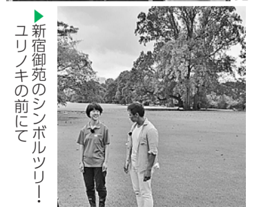
▶新宿御苑のシンボルツリー！