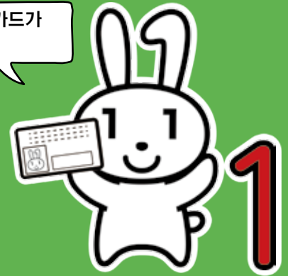
마이넘버 캐릭터 '마이 나짱'