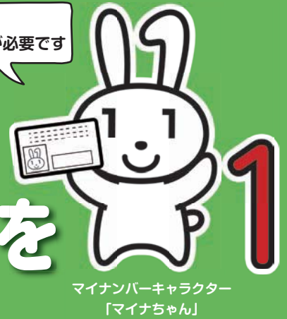
マイナンバーキャラクター 「マイナちゃん」