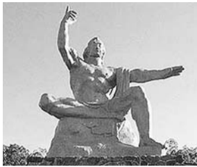
▲平和祈念像(長崎市)

平和の尊さと戦争の悲惨さについて学び、平和への意識を高めていただくため、次代を担う子どもたちと保護者(7組14名)を、広島と長崎へ隔年で派遣しています。