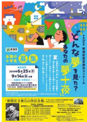
絵画コンクール案内チラシ

【作品の規定】八つ切りサイズ(27cm×38cm)の画用紙に、鉛筆・色鉛筆・クレヨン・絵の具・マジック・サインペンなどで描いてください。縦横は自由です(立体的でない貼り絵、切り絵、版画も可。デジタル作品と額装は不可)。