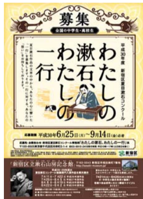
読書感想文コンクール案内チラシ

【作品の規定】縦書きの400字詰め原稿用紙2枚半~3枚(1,000字~1,200字)に、日本語で書いてください。