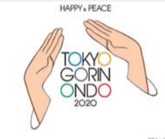
▲東京五輪音頭2020ロゴ

【日時・会場】右表のとおり。いずれも時間は午後6時30分~7時40分(7月1日(日)のみ午後2時~3時10分) 【持ち物】室内履き、飲み物、タオル 【協力】しなの会 【申込み】当日直接、会場へ。