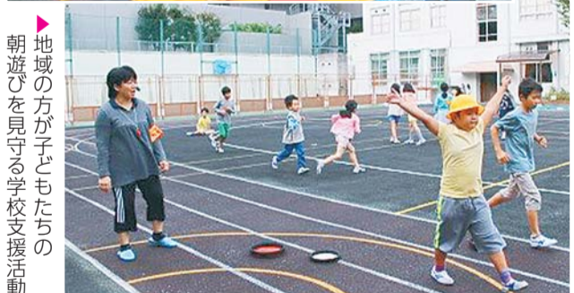
▶ 地域の方が子どもたちの 朝遊びを見守る学校支援活動