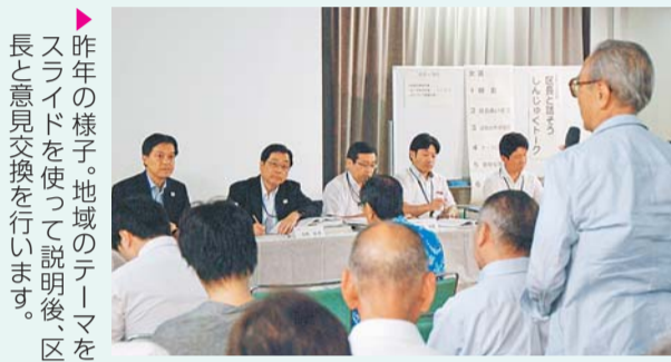
▶ 昨年の様子。地域のテーマを スライドを使って説明後、区 長と意見交換を行います。