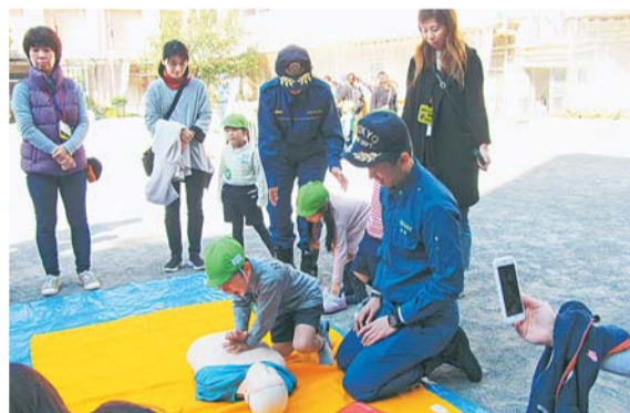
▶ 地域の防災意識を 高める避難所防災訓練

【問合せ】区政情報課広聴係(本庁舎3階)☎(5273)4065・☎(5272)5500へ。