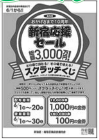
▲くじが使用できる店舗にはポスターが貼ってあります

キャンペーン参加店では、スクラッチくじ方式の抽選券を6月20日(水)まで配布しています(なくなり次第終了)。1,000円・100円の当たりくじをお持ちの方は、金額相当の金券として6月30日(土)まで使用できます。使用できる店舗は、新宿区商店会連合会公式ホームページ「新宿ルーペ」( http://shinjuku-loupe.info/ )でご案内しています。