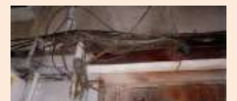
外壁沿いに輻輳するケーブル