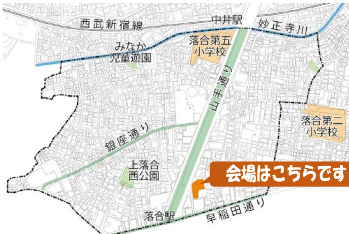
地区の範囲（上落合二丁目（一部）・三丁目）

【地区内にお住まいの方や、土地・建物の権利をお持ちの方は、どなたでも参加可能です！】