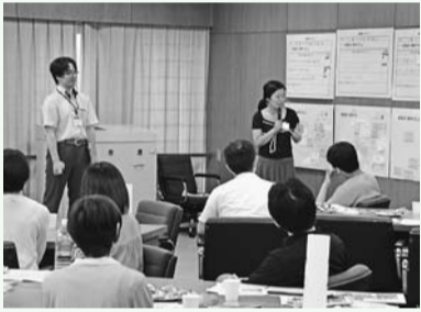
▲しんじゆく若者会議

ICTを活用した英語教育の推進 ● 中学校への特別支援教室の設置(西早稲田中・西新宿中・新宿中) ● 学校トイレの洋式化(小学校14校) ● 英検受験費用の補助(区立中学校2年生対象) ● 児童相談所・一時保護所の設置、運営体制の整備推進 ● ワーク・ライフ・バランスの推進 ● しんじゆく若者会議の開催、しんじゆく若者意識調査の実施