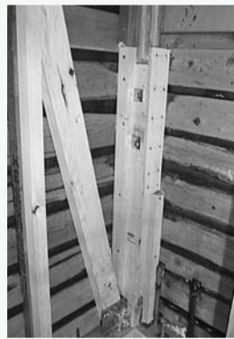
▲耐震補強の例(筋かい)

建築物等の耐震性強化 ● 木造住宅の耐震改修工事への補助上限額の引き上げ ● 耐震診断や補強設計への補助上限額の引き上げ