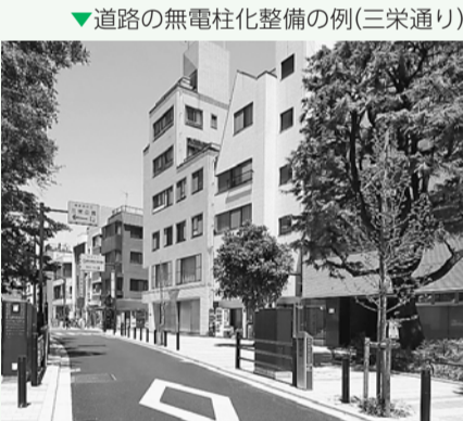
▼道路の無電柱化整備の例(三栄通り)

道路の無電柱化整備(聖母坂通り、補助第72号線、甲州街道脇南側道路、四谷第六小学校南側区道、女子医大通り、四谷駅周辺区道)