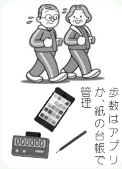
歩数はアプリか、紙の台帳で管理

健康ポイント事業の実施 ● 日常生活の中で歩いて貯める「ウォーキングポイント」の付与等による健康づくりへの参加を促す環境の整備