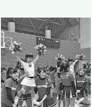
▲東京2020オリンピック・パラリンピック1000日前イベント「子どもスポーツデー」

「しんじゆく逸品の普及 ● 「しんじゆく逸品マルシェ」の開催 ● 新宿ブランドの開発に向けた支援 ● 新製品・新サービス開発支援助成 ● 全業種を対象に区内中小企業の新たな製品・サービス開発事業に係る経費の一部を助成 ● 事業承継準備支援セミナーの開催 ● 商店街の魅力づくりの推進 ● 商店会情報誌の発行 ● 大学等との連携による商店街支援 ● 漱石山房記念館の更なる魅力の向上 ● 新宿フリーWiFiの整備等 ● 新宿観光案内所の案内体制の強化 ● (仮称)新宿区スポーツ施設整備基金の設置、新宿スポーツセンターの設け工事 ● 東京2020オリンピック・パラリンピックの開催77日前と500日前を記念したイベントの開催等