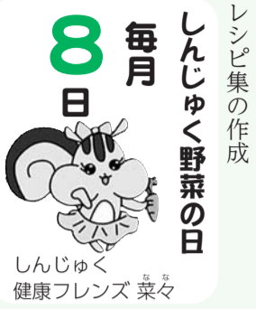
しんじゆく健康フレンズ 菜々

健康な食生活へのサポート ● 簡単な野菜料理が学べる講座の開催 ● ポスター等普及啓発ツールの作成 ● レシピ集の作成