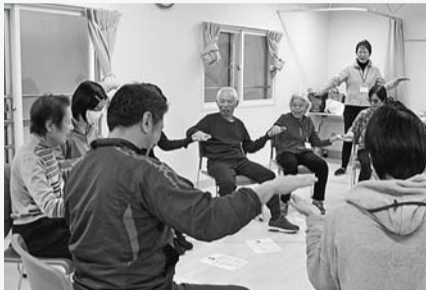
▲ささえあい館 薬王寺の介護予防運動講座

「新宿区立薬王寺地域ささえあい館」ささえあい館(薬王寺)を拠点とした多世代による「地域支え合い活動」の推進 ● 「地域支え合い活動」に関する相談・支援等を行う地域ささえあい館活動支援員を設置 ● 各種講座の実施