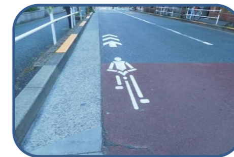
<整備イメージ> 自転車ナビマーク