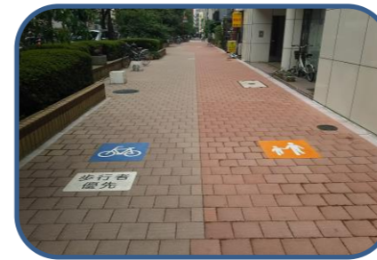
<整備済写真> 早大通り(外苑東通り西側)