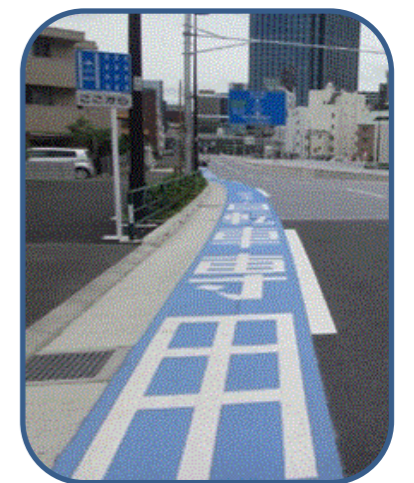
<整備イメージ> 自転車専用通行帯