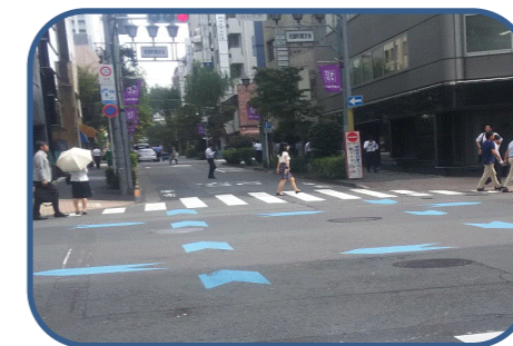
<整備イメージ> 自転車ナビライン