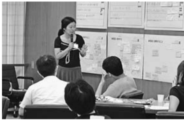
▲しんじゅく若者会議の様子

315万9千円 若者の意識やアイデアなどを、区政に反映させるための効果的な仕組みづくりを進めます。