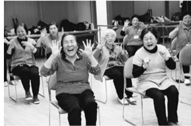
▲いきいき体操講習会

3,420万3千円 高齢者が住み慣れた地域でいつまでも健康に暮らし続けられるよう、地域の中で人とつながりながら健康づくりや介護予防に取り組むことができる仕組みづくりを進めます。