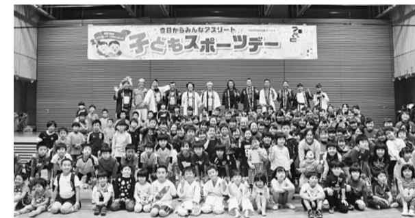
▲1000日前記念イベントこどもスポーツデーの様子

928万8千円 東京2020オリンピック・パラリンピック競技大会開催に向けて、メインスタジアムを持つ区として、区民の記憶に残る大会となるよう、気運醸成を図っていきます。