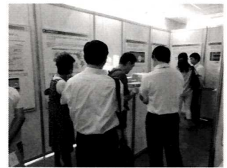
※これまでの説明会の様子