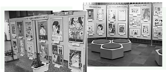
▲昨年のポスター展の様子