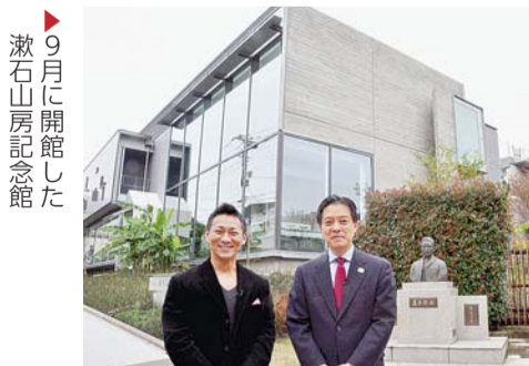
9月に開館した 漱石山房記念館

吉住健一区長が、区政情報や新宿のまちの多彩な魅力をお届けする区の広報番組です。12月は、「記念館めぐり」をテーマに漱石山房記念館や中村彝アトリエ記念館などを紹介します。