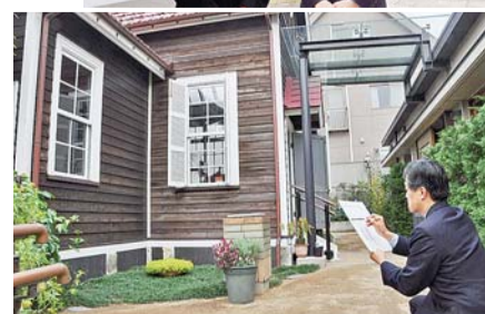
中村彝アトリエ記念館 で区長がスケッチ